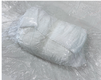
パック済み紙おむつ