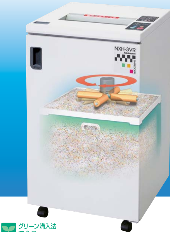
ロータリーローラープレス機構付き