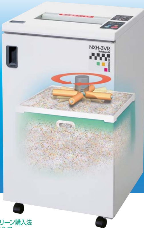
ロータリーローラープレス機構付き